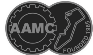
中國-澳門汽車總會 Associação Geral de Automóvel de Macau-China